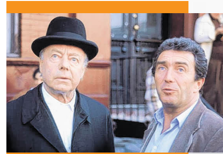
Mit Heinz Rühmann beim Dreh für „Ein Zug nach Manhattan“ (1981)