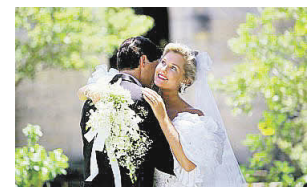
Hier war der Antrag erfolgreich.

Die meisten Leute lassen sich da viel zu sehr verrückt machen. Wichtig ist, zunächst einen passenden Ort für die Feier zu finden und einen Termin zu sichern. Und Freunden und Verwandten Bescheid zu sagen. Um die Details kann man sich nach und nach in Ruhe kümmern. Und dann gibt es ja auch noch uns Hochzeitsplaner.