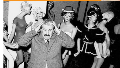
„Dicke Luft“ mit Hauptdarsteller Willy Millowitsch (1962)